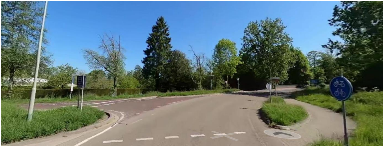
Aansluiting Kasteel Wijlreweg: sbs vervangen door asfaltpakket (15 cm)