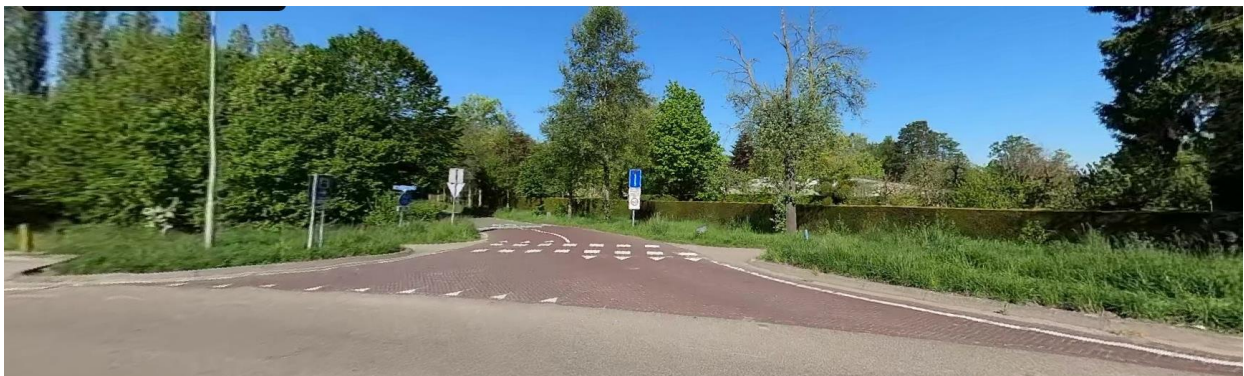
Tot en met de kruising Kasteel Wijlreweg is nieuwe asfalttoplaag. Daarna richting Gulpen is overlaging met SMA 0/8