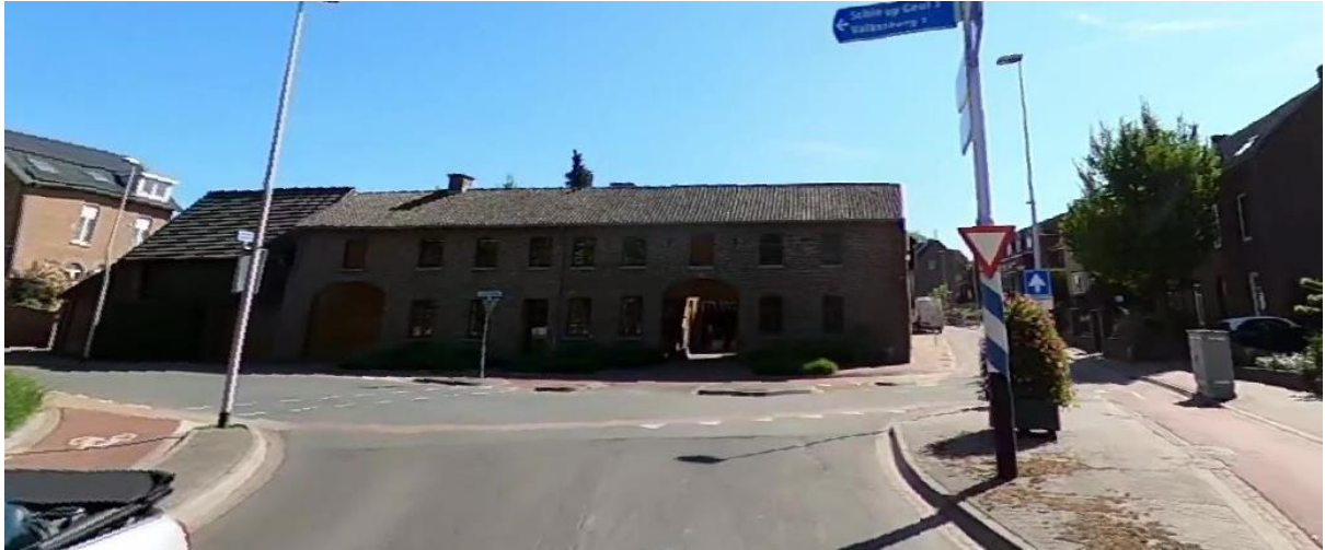
Aansluiting op provinciale weg N595. Afstemmen met Provincie (maatregel en verkeersmaatregelen)