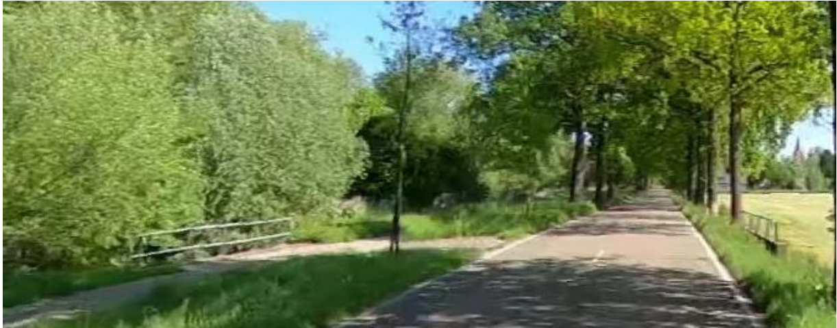
Aandachtspunt is civiel kunstwerk: onderzoek asfaltpakket op kunstwerk