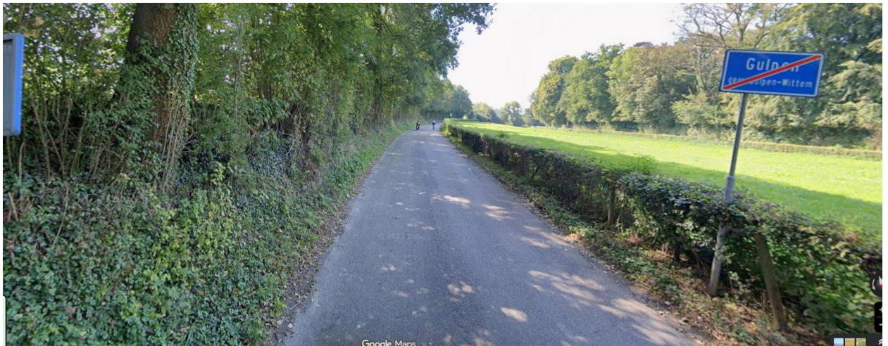
Zorgdragen dat water via berm (onder de haag door) kan afwateren. Na overlaging bermen beoordelen en niet te hoog aanvullen