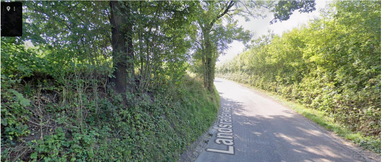
Nieuwe gestorte betonband kort langs bomen. Betonmachine met slee op het asfalt