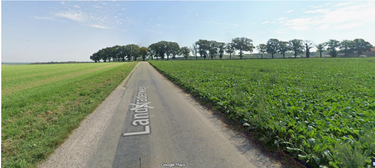
Ontwerp binnen eigendomsgrenzen