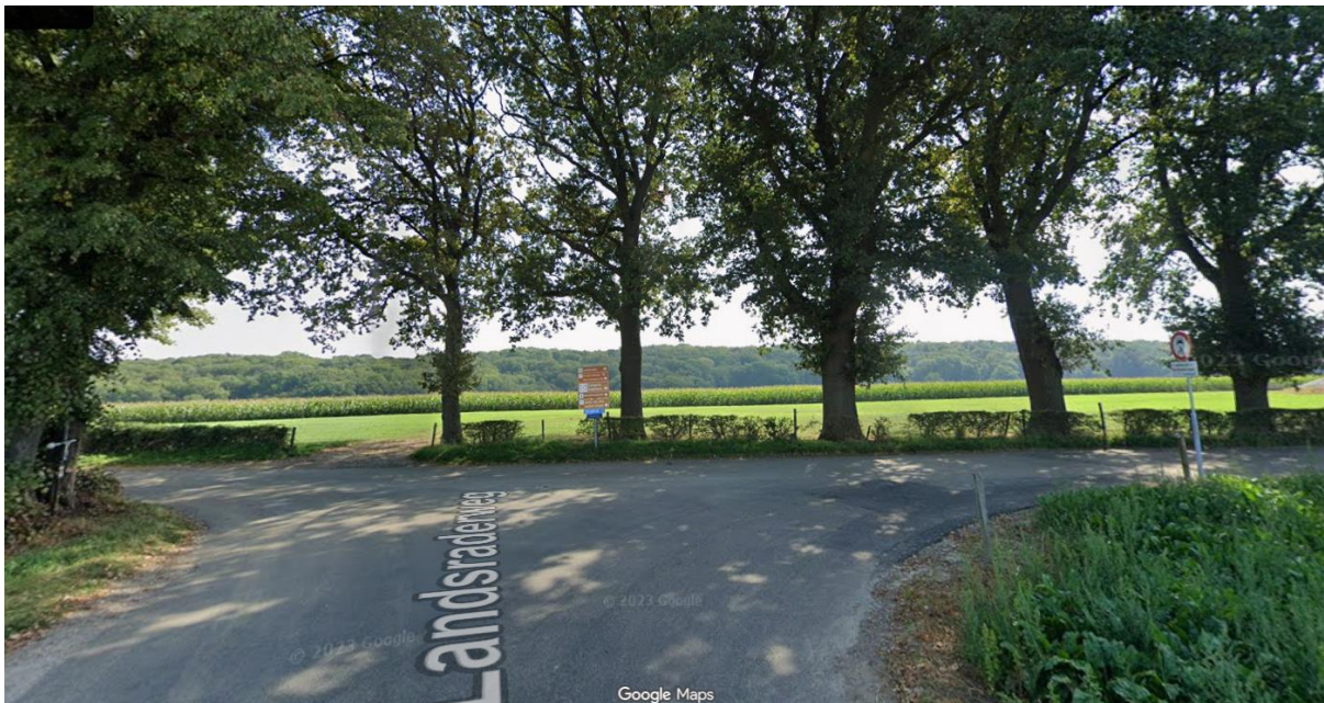
T-splitsing meenemen in project (tangentpunten). Doorgang Berghem-Landsraderweg (richting Crapoel) zo lang mogelijk open houden en kortstondig afsluiten. Asfalt beoordelen (kwaliteit en dikte) en aangeven of alleen toplaag of compleet pakket aangebracht moet worden op deze kruising.