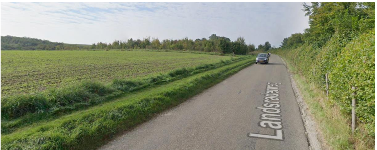
Eigendomsgrenzen vooraf bepalen bij het ontwerp