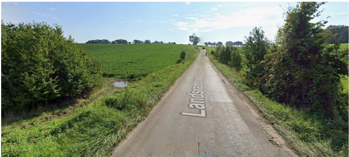
Laagste punt- afwatering via weiland > aandacht voor hoogte bermen