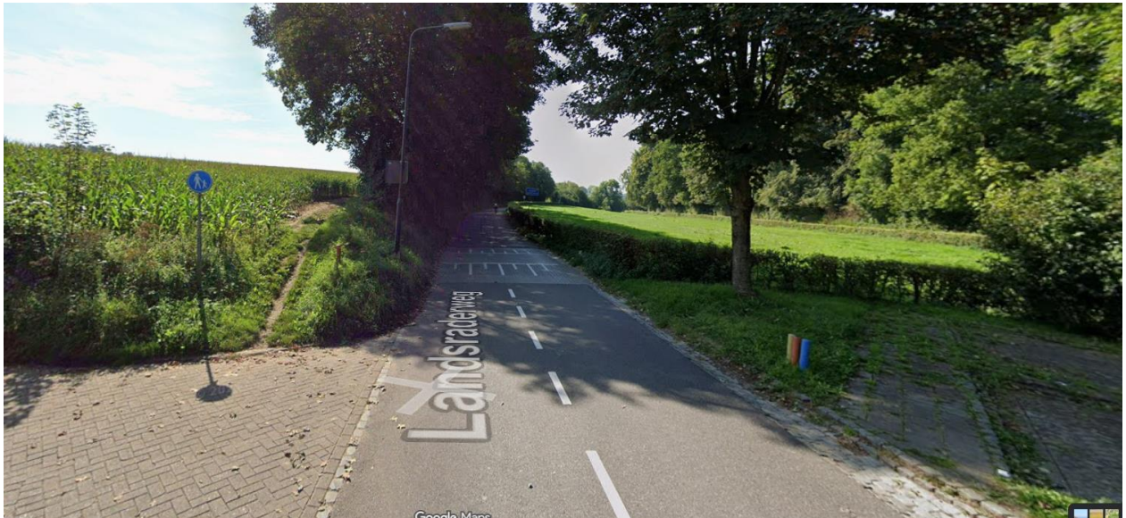
Afgraven/afschuinen talud voor beter uitzicht vanuit de parkeerplaats op de Landsraderweg