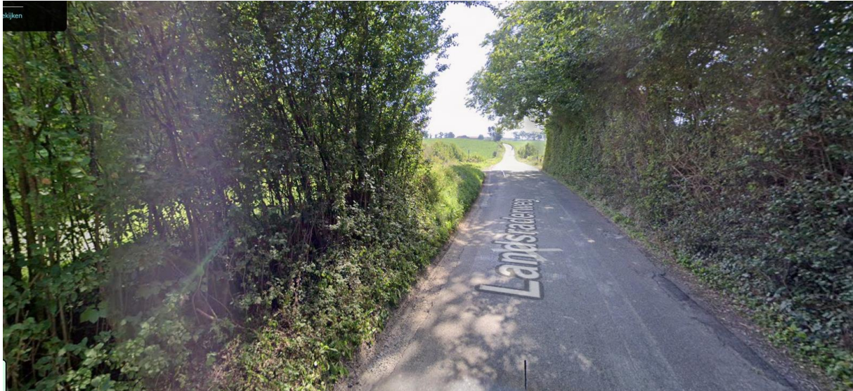
Gestorte Betonband dicht langs groen: rekening houden met betonmachine