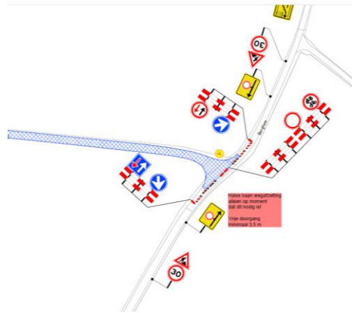
Einde werkvak. T-Splitsing zo lang mogelijk open